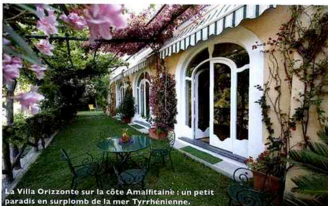
La Villa Orizzonte sur la côte Amalfitaine : un petit paradis en surplomb de la mer Tyrrhénienne.